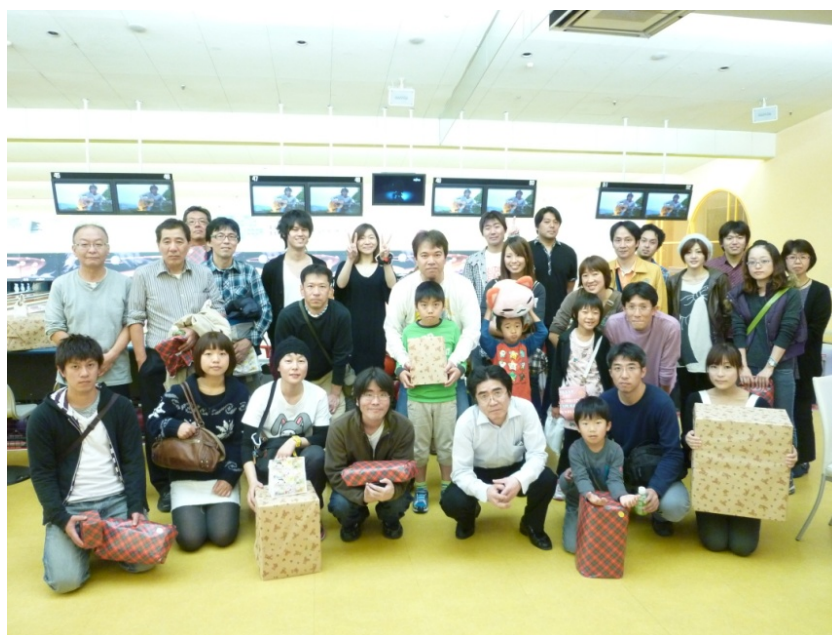
県立総合病院 赤池

怪我やトラブルもなく無事終わることができ、お忙しい中多数御参加いただいたおかげで、大変良い交流の場となりました。ありがとうございました。